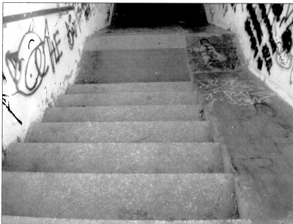
Particolare scala e rampa laterale