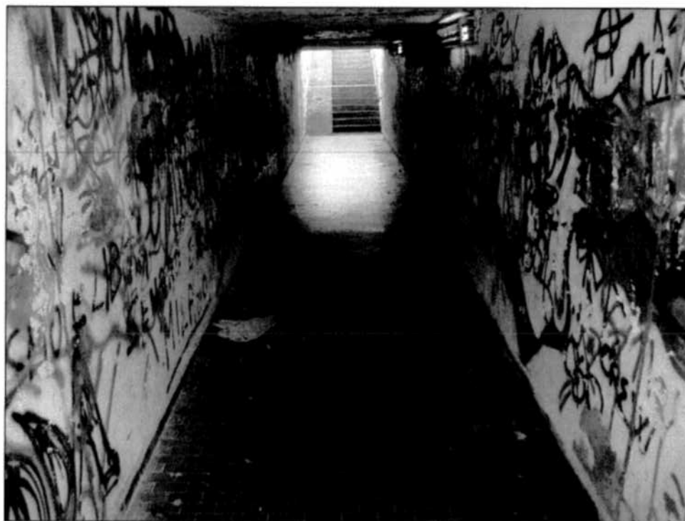
Particolare corridoio sottopasso