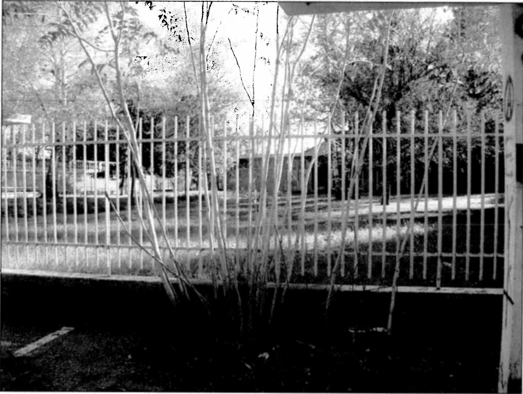
Area verde ex scuola materna Borello

SOTTOPASSO PEDONALE DI COLLEGAMENTO DELLA VIA PIETRE CON VIALE DELU'.