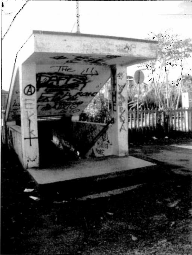
Sottopasso Via Pietre