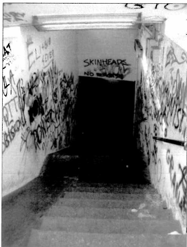
Vista scale e rampa laterale